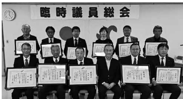
（前列中央は高野会頭）