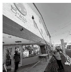
▲市内の生花店の正面もきれいにWASH!!

創業10年の節目にスタートしたK-WASHを、ぜひ皆さまの職場やご自宅でお役立ててください！