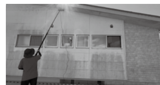
▲壁面クリーニング作業