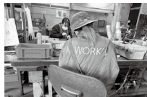
▲工場内は多くが女性社員

30歳を過ぎて小千谷青年会議所に入会した際に、地元・小千谷の鉄工電子業界の魅力に改めて気づき、「この業界で役に立てることがまちのへ貢献につながる」と感じて独立を決意しました。