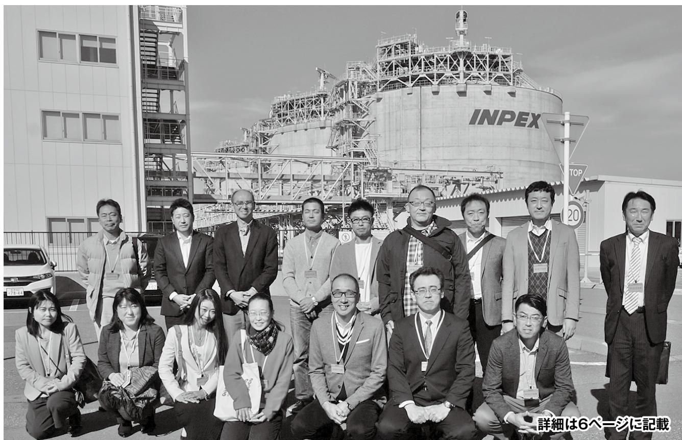
詳細は6ページに記載