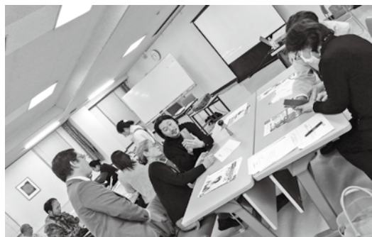
写真家の池田氏による指導の様子

おぢやまちゼミの会では、まぢゼミ参加店以外の事業所も参加可能なSNSを商売に繋げるセミナーを継続的に開催予定です。