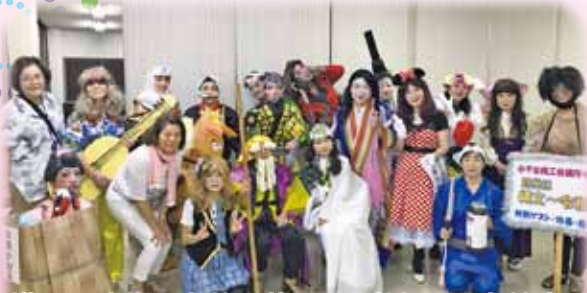
様々な時代の衣装で盆踊りに参加した女性会。 仮装コンテストでは見事上位入賞(^^)v