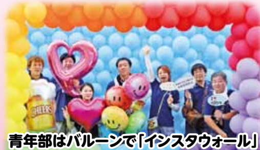
青年部はバルーンで「インスタウォール」 (インスタ映えする壁)をイオン駐車場に設置。 万灯出発式の集客にひと役買いました♪