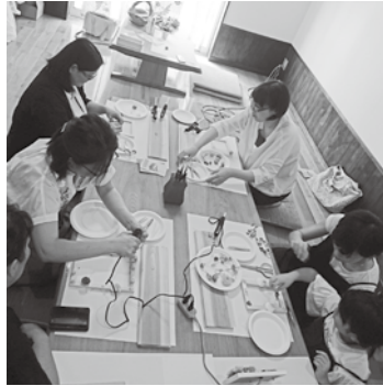
自由研究お手伝い「オリジナルフォトフレーム」の様子（衛星野工務店）

第10回おぢやまちゼミでは、①まちゼミ期間終了後、参加店で使えるクーポンの配布②イベントチラシに小千谷市公共交通マップの掲載③事務作業の軽減化（申込データ等の電子化）等を新たに取り入れ実施しました。