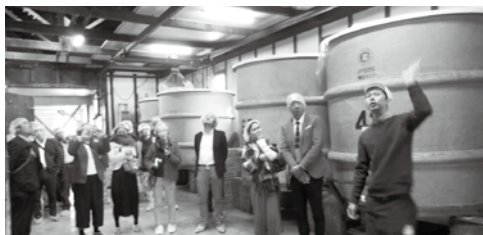
(株)峰村商店 視察の様子

他社の取り組みを視察することでしか学び感じることができないものがあります。青年部では、会員企業の事業発展の為、このような視察研修を引き続き実施していく予定です。各企業の後継者様の入会をお待ちしております。