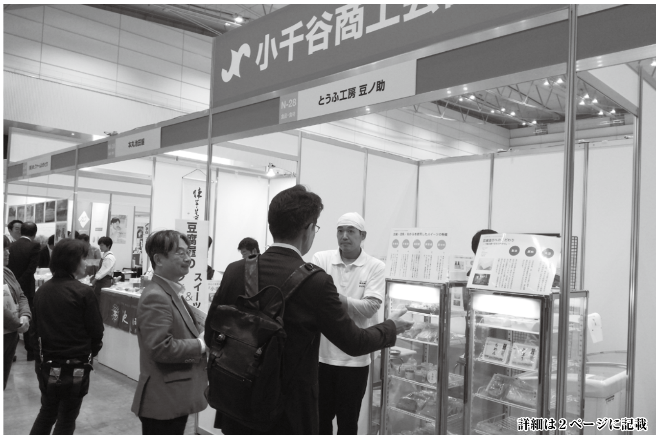
詳細は2ページに記載