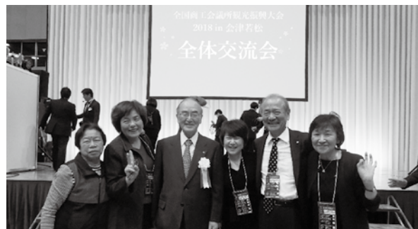
日商 三村会頭(左から3番目)と一緒に

全体会議での各講師からは、インバウンドの観光客は年々増加しており、客はモノからコトへと興味が移りつつある。その対策としては、地元資源を生かした外国人目線での体験型コンテンツを拡充しながら、行政や県境、団体の壁を越えて取り組むことが重要。また、観光は過渡期に入っているため新たな感動地を作ることが必要であり、それには地域が持っている生活文化に感動と共感を与えることであるとの講演がありました。