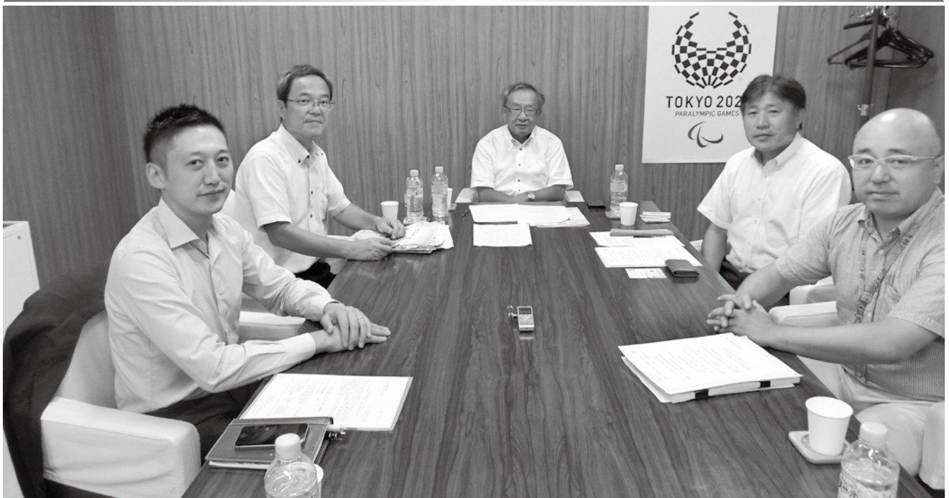
創刊500号記念座談会（8ページに掲載）