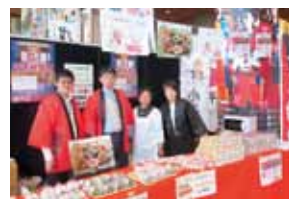
新潟日報社メディアシップ会場にて

去る5月2日、戊辰150年を記念し上演された「小千谷談判」劇の中継地である新潟日報社メディアシップにおいて、当プロジェクトが開発した地酒「小千谷談判」と「錦鯉の酒器」、今話題の「笹風ちまき」を販売し小千谷を盛大にPRしてきました。