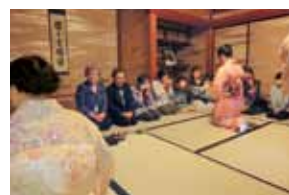
西脇邸でのお茶会