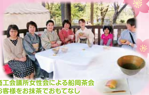
商工会議所女性会による船岡茶会 お客様をお抹茶でおもてなし