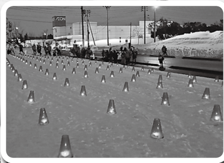
幻想的な「ふきの灯」を設置しました