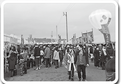
うまいもの広場は大盛況