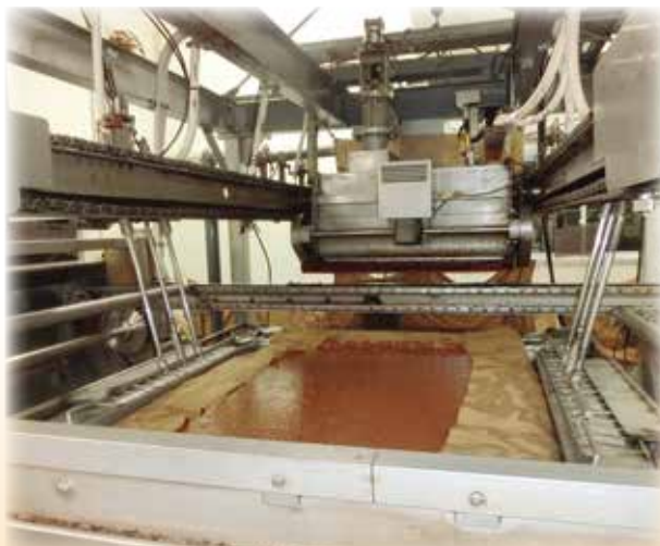
発酵したもろみを布で包んで生のしょうゆを絞ります