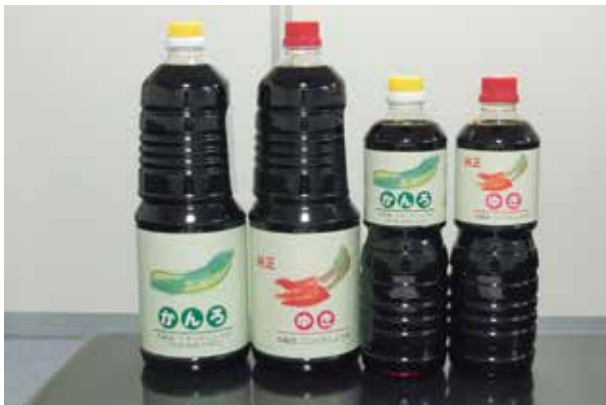
受賞商品の本醸造特級うすくち醤油「かんろ」と本醸造特級こいくち醤油「ゆき」

どちらの醤油も当社の定番商品であり、普段から皆様のお手元に届く商品が専門家の方々から評価されるという事は光栄なことであるとともに、この賞の名に恥じぬような良質で安心、安全な商品作りに今後も努めてまいります。