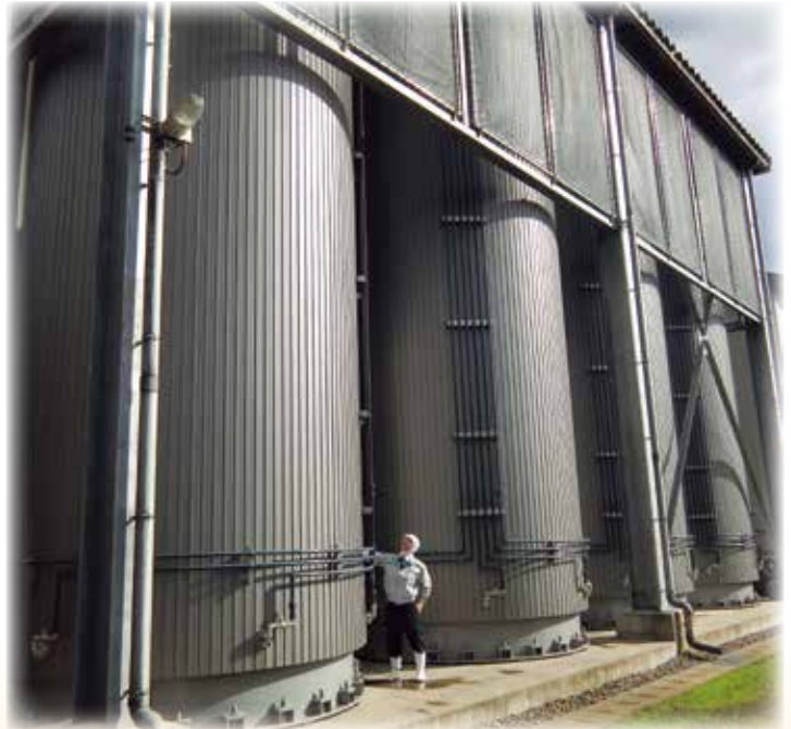
屋外発酵タンク(大きい!)で数ヶ月かけてもろみを発酵させます

どちらの醤油も当社の定番商品であり、普段から皆様のお手元に届く商品が専門家の方々から評価されるという事は光栄なことであるとともに、この賞の名に恥じぬような良質で安心、安全な商品作りに今後も努めてまいります。